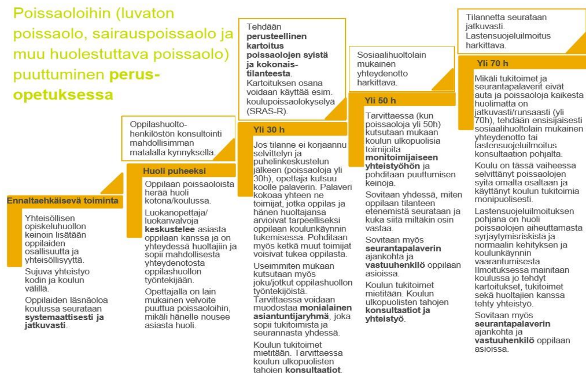
Kuva 5: Poissaoloihin puuttumisen malli

Poissaoloja on seurattava systemaattisesti ja jatkuvasti. Seurannasta vastaa luokanopettaja/luokanohjaaja/ryhmänohjaaja. Poissaoloja on tulkittava herkästi ja yksilöllinen oppilas ja tilanne huomioiden.