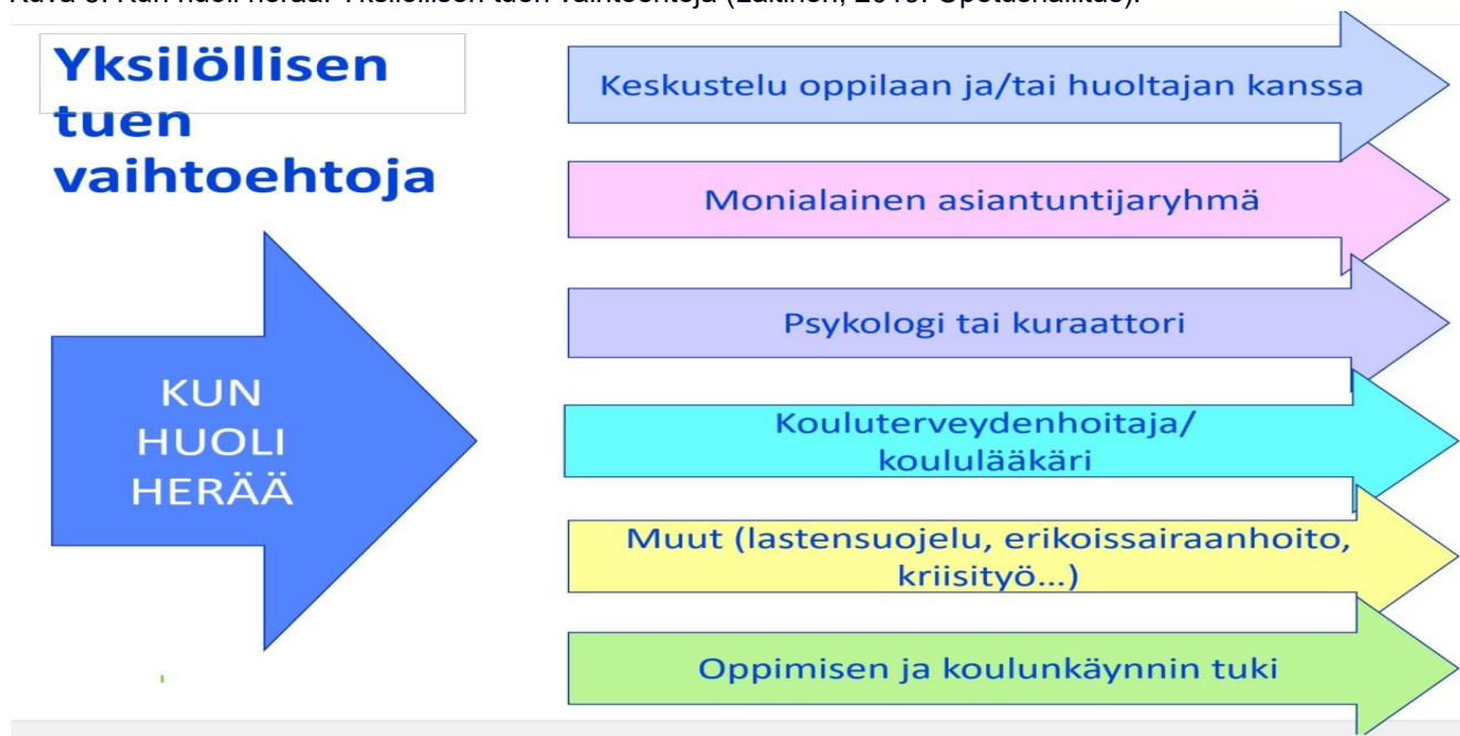
Kuva 3: Kun huoli herää: Yksilöllisen tuen vaihtoehtoja (Laitinen, 2019. Opetushallitus):

Jos oppilaasta on lastensuojelullista huolta, tulee työntekijän välittää huoli lastensuojeluun (kts Lastensuojelulaki 25§). Jos on epäily perheen sisäisestä väkivallasta tai seksuaalirikoksesta, niin rikos- ja lastensuojeluilmoitus tehdään välittömästi ilmoittamatta huoltajille.